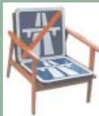
L'ART DE LA ROUTE