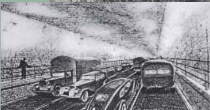
AUTOROUTE TRAVERSEE DE LYON